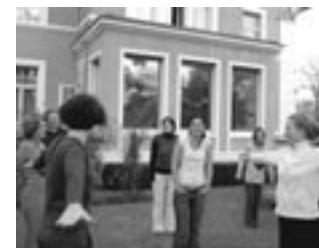
Seminář pro vedoucí mládeže na téma: Interkulturní učení v česko-německém kontextu