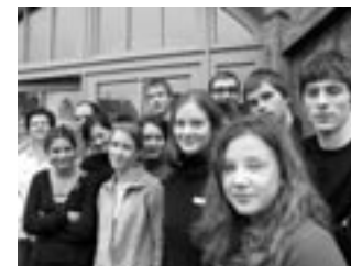
Projekt Demokracie a média

K finančně nejvýrazněji dotovaným projektům patří stejně jako v minulosti roční studijní pobyty středoškoláků , jejichž počet se již několik let pohybuje kolem 100 uchazečů ročně, a projekt odborných praxí pro středoškoláky a učně , organizovaný Koordinačním centrem česko-německých výměn mládeže Tandem. V roce 2006 bylo na tyto projekty vyčleněno téměř 6 mil. Kč. V rámci těchto dlouhodobých pobytů dochází u mladých lidí k hlubšímu poznání životních podmínek v sousední zemi a tím k reálnější představě o budoucí česko-německé spolupráci. Mnozí z bývalých účastníků těchto výměnných pobytů