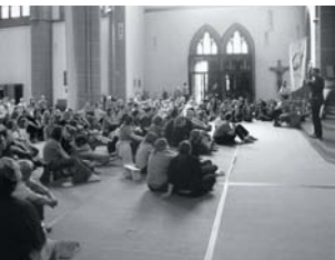
Weltjugendtag in Köln am Rhein

mit, Jugendliche mit dem Alltag ihrer Nachbarn bekannt zu machen. Dabei handelt es sich einerseits um die Gastschuljahre , die jährlich von etwa 100 Schülern wahrgenommen werden. Andererseits werden durch die gelungene Organisation des Koordinierungszentrums Deutsch-Tschechischer Jugendaustausch Tandem auch Berufsschüler und Lehrlinge mit Praktika-Angeboten erreicht . Diese Studienaufenthalte und Berufspraktika wurden 2005 mit etwa 200 000 € gefördert. Bei einem längeren Aufenthalt im Nachbarland gewinnen die jungen Leute tiefergehende Erkenntnisse über die Lebensbedin-