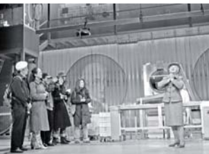
Prager Theaterfestival deutscher Sprache – Burgtheater Wien

Auch im Jahre 2005 ließ sich beobachten, dass die Partnerschaft zwischen den deutschen und tschechischen Kulturschaffenden wächst und dass sie „von unten“ vorangetrieben wird, d.h. dass sich nicht nur große Institutionen daran beteiligen, sondern dass die praktische deutsch-tschechische Zusammenarbeit sich auch in vielen kleineren Projekten zeigt. Dazu gehören v.a. Ausstellungen, Literatur-, Tanz- und Musikprojekte, bei denen deutsche und tschechische Künstler zusammen arbeiten.