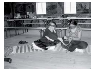
Umweltbildung im Zentrum Suchopýr

Ähnlicher Abwechslungsreichtum ist bei den Projekten für behinderte Kinder und Jugendliche zu finden, denen der