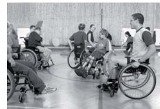
Ausbildungscamp für tschechische und deutsche Rollstuhlfahrer und ihre Assistenten