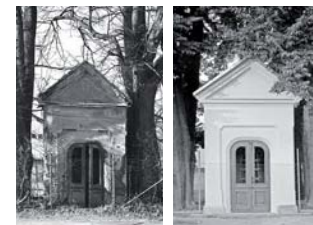
Erneuerung der Kapelle in Liberec-Staré Pavlovice

Außer den Kulturdenkmälern unterstützte der Fonds auch die Schkola Oberland – Schkola Rumburk , die als Schule der Begegnung und Nachbarschaft an der deutsch-tschechischen Grenze konzipiert ist. Deutsche Schüler belegen dort ab der ersten Klasse Tschechisch als Pflichtfach.