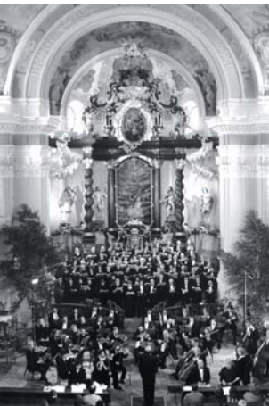
Rekonstruktion der Barockkirche des Hl. Nikolaus in Bor bei Tachov